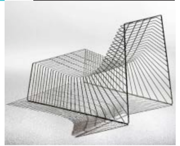
"Frame Work" er resultatet af Niels Hvass' soloindsats til SE i 2006.