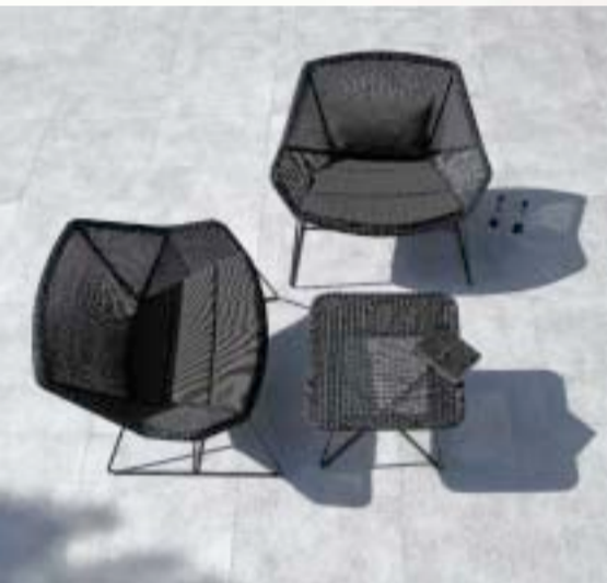
"Breeze Lounge" er designet af Strand + Hvass for Cane-Line i 2008 i en kollektion, der også omfatter spisebordsstol, loungebord, hvilestol og sidebord. Koster 3.099 kr.