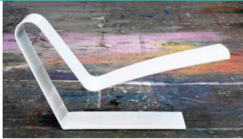
"Jump" blev designet af Niels Hvass til SE-udstillingen i 2007. »Stolen udgøres af en bukket aluminiumsplade – i princippet blot en fjederklips, hvor den meget lange fjeder giver en fantastisk bevægelsesoplevelse,« forklarer han.